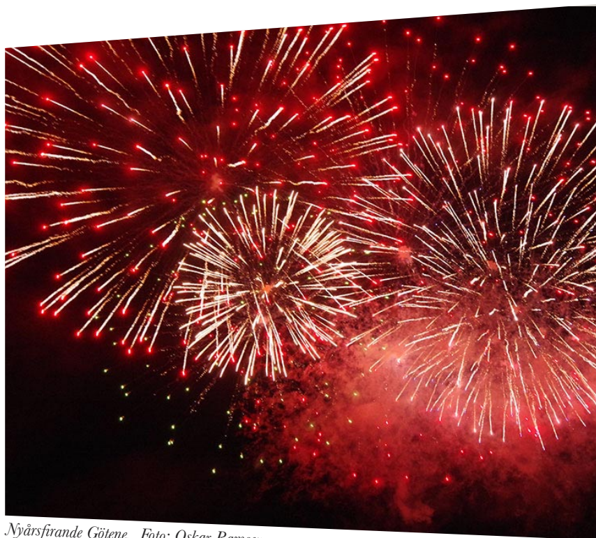
Nyårsfirande Göteborg.