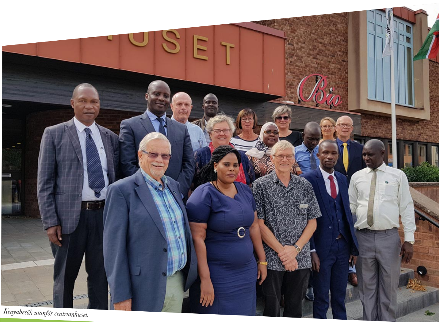
Kenyabesök utanför centrumhuset.

Investeringar planeras för en fyraårsperiod. Plan 2019-2021 med tillägg på 40 mnkr för 2022 ger en budgetram på 153 mnkr. Till följd av stora behov, bland annat av renoveringar samt om- och tillbyggnader, föreslås investeringar på 161,4 mnkr. Under 2019 kommer antalet platser för särskilt boende inom äldreomsorgen att utökas. Den investeringen genomförs av Götene Äldrehem.