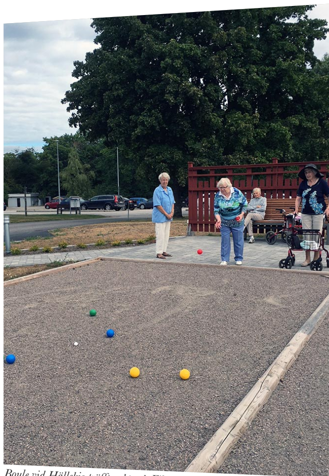
Boule vid Hällekis träffpunkt och Fikadags.