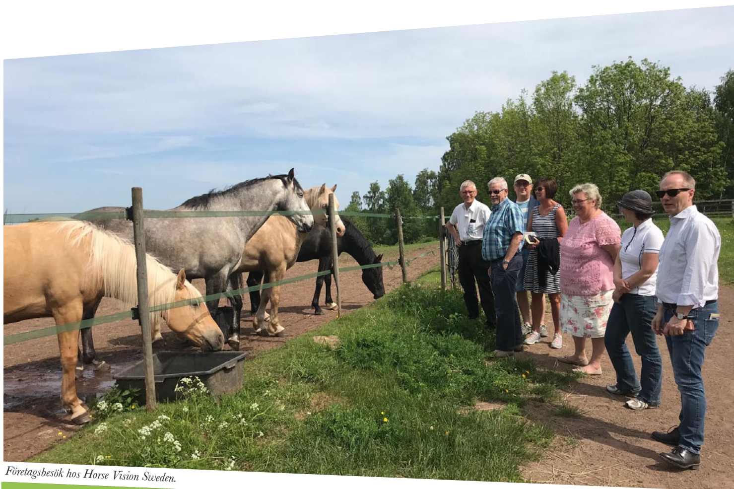
Företagsbesök hos Horse Vision Sweden.

Antalet äldre ökar och därmed behovet av fler platser i särskilt boende. Under 2019 kommer utbyggnationen vid Kastanjegården vara inflyttningsklar. Budgeten är för inventarier till boendet. Byggnationen sker i Götene Äldrehems regi och ingår inte i kommunens investeringsbudget.