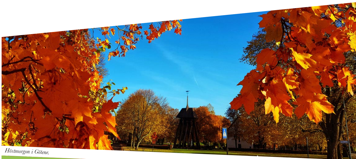
Höstmorgon i Götene.