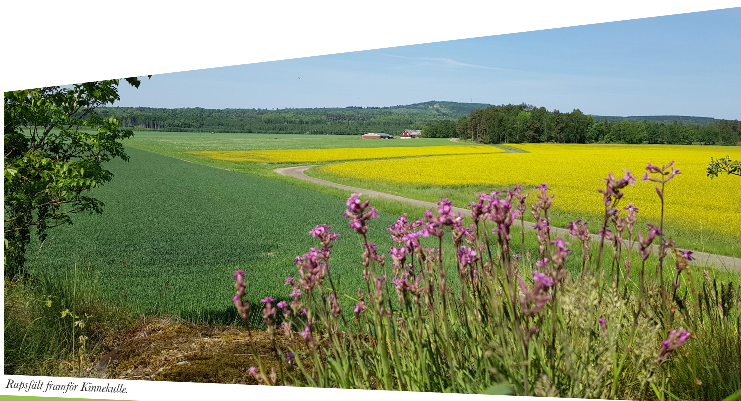
Rapsfält framför Kinnekulle.